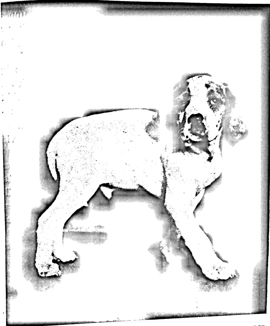
HUSABY-DREAM OF DELIGHT (E. SÖRÄNGENS LYX U. CHAMP. SKOGIS-LEILA), SJU VECKOR GAMMAL

törer och jag fick en hel del fågel ur marken som jag trodde mig hava bommat på, men för stora, vida, fågelfattiga fält passade dessa hundar ej.