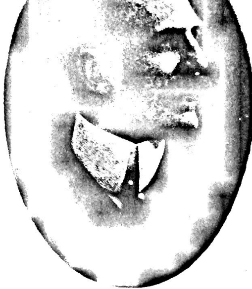
AX. HEDENLUND Kennel H. från Sik.