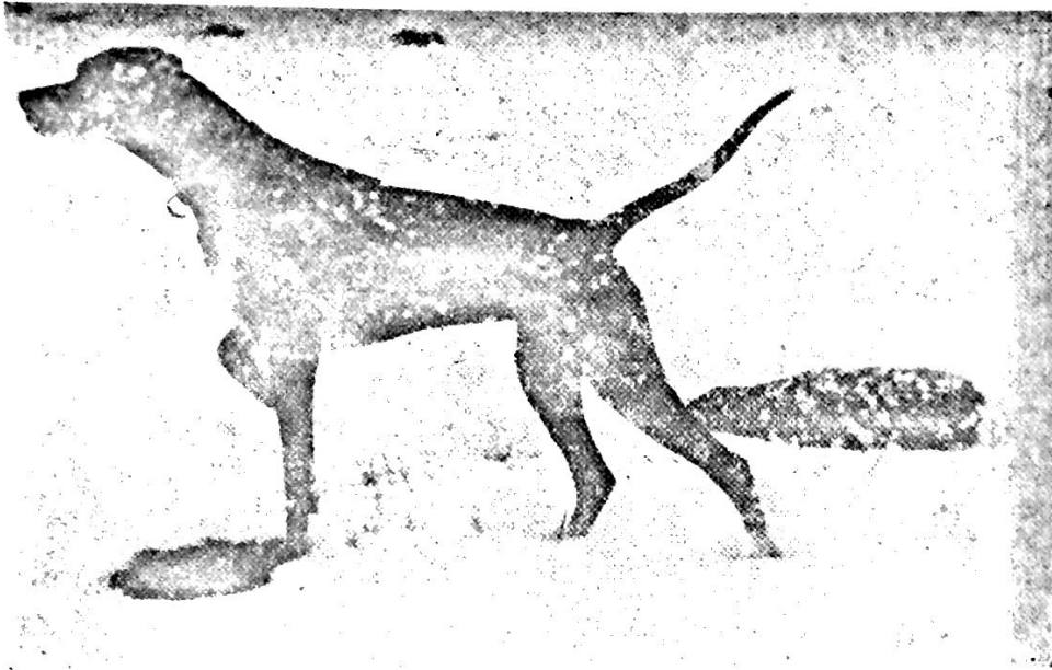
SÖRÄNGENS MAY I SNÖ